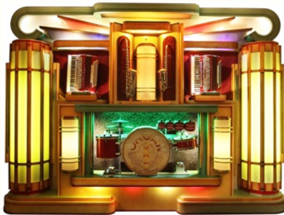
Tanzorgel „DECAP“ Antwerpen, ca. 1950

Das Musik-Museum lässt die alten Klänge wieder erwachen, führt Sie zurück in die nostalgische Atmosphäre früherer Zeiten und zeigt Ihnen auf Original Instrumenten eine Präsentation musikalischer Unterhaltung aus fast zwei Jahrhunderten.