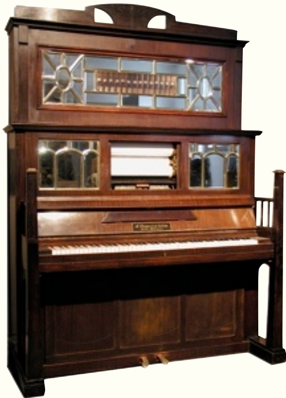
Orchestrion „Fratinola“ Berlin, ca. 1910

Sehen Sie, wie Instrumente wie von Geisterhand gespielt werden und lassen Sie sich von der fröhlichen Musik früherer Jahre anstecken!